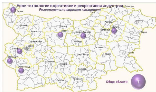
Regionalni inovativni kapaciteti u Bugarskoj u oblasti novih tehnologija u kreativnim i rekreativnim industrijama

U tom kontekstu, očigledno je da je potrebno više napora i organizovanih aktivnosti od strane visokog obrazovanja, biznisa i profesionalaca koje bi motivisale donosiocima odluka na regionalnom i lokalnom nivou da unaprede svoje politike, prilagode ih rastu i inovativnom potencijalu KKI i investiraju u njih.