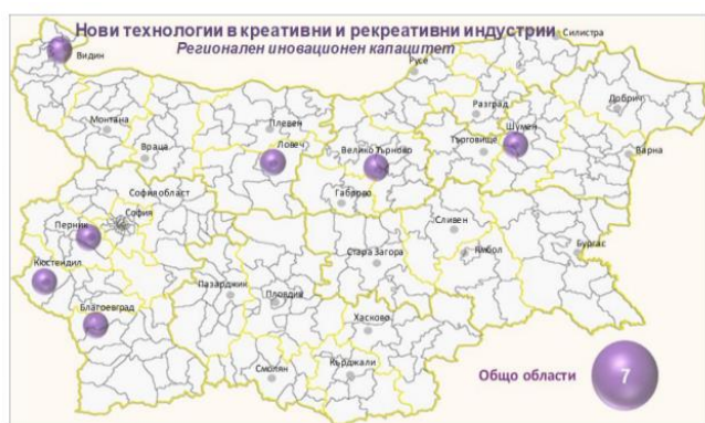
Capacitatea regională de inovare în Bulgaria în domeniul noilor tehnologii în industriile creative și recreative

În acest context, este evident că este nevoie de mai multe eforturi și de o activitate organizată din partea instituțiilor de învățământ superior, a mediului de afaceri și a profesioniștilor pentru a motiva factorii de decizie la nivel regional și local să își actualizeze documentele de politică, astfel încât să țină seama de potențialul de creștere și inovare al ICC și să investească în acestea.